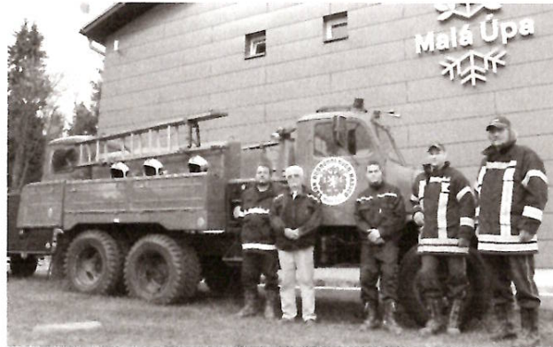
HASIČI Z MALÉ ÚPY mají základnu přímo na česko-polské hranici.

POZOR! Hlasy pro hasiče z Malé Úpy posílejte do pátku 20. května do 15 hodin. Každý, kdo pošle SMS zprávu, má šanci získat pivo na měsíc zdarma. Počet SMS z jednoho telefonního čísla není omezený.